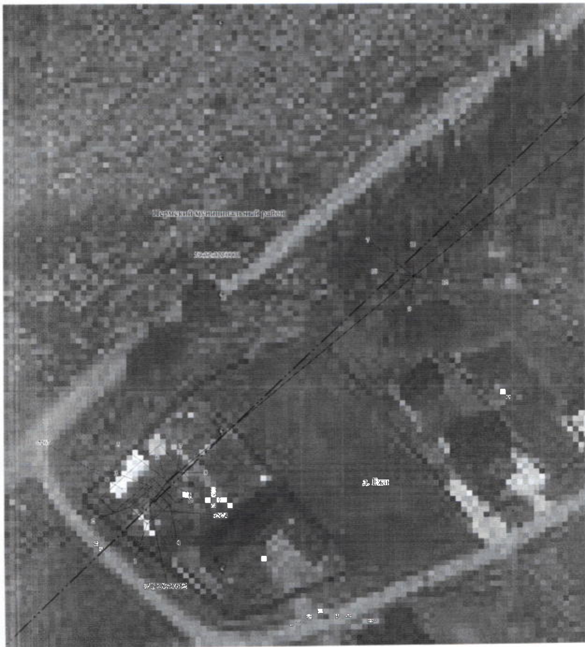
План границ объекта