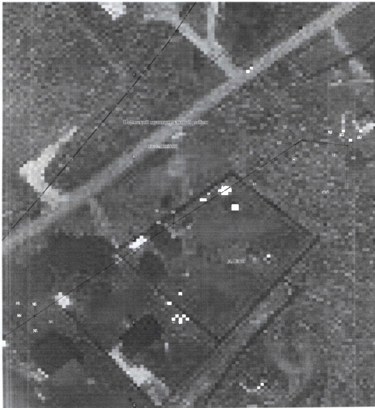
План границ объекта