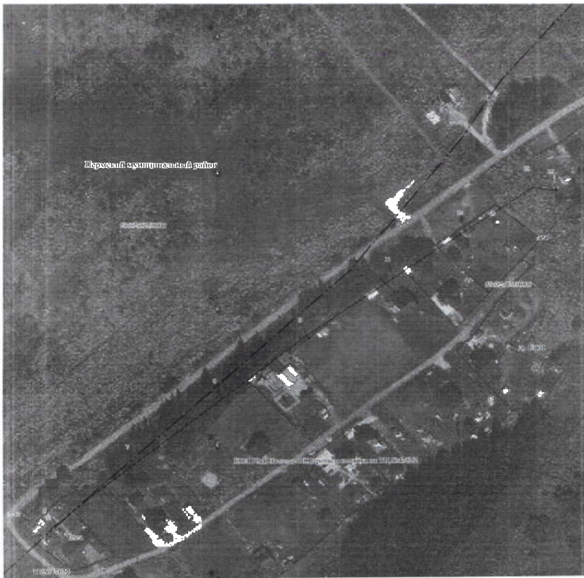
План границ объекта